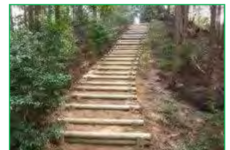
【東海自然歩道】登山道整備