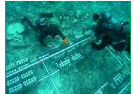
【西表石垣国立公園】自然再生事業