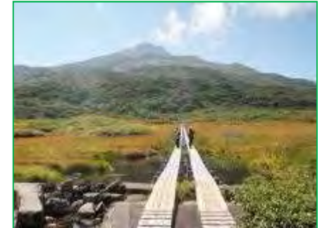
【鳥海国定公園】木道整備