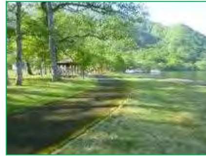
【十和田八幡平国立公園】園地整備