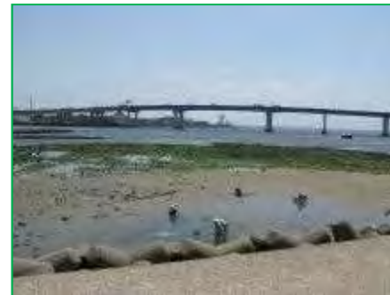
【国指定浜甲子園鳥獣保護区】保全事業