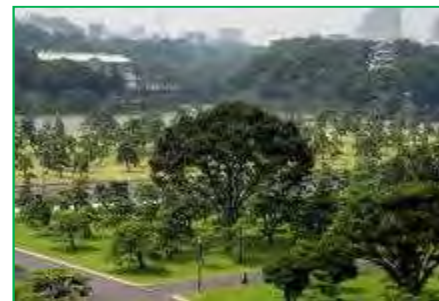
【皇居外苑】苑地維持管理