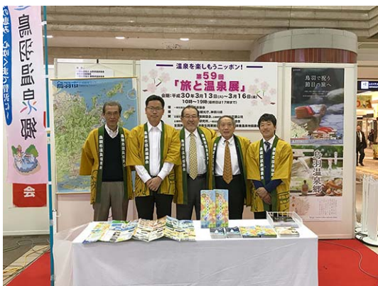
三重県・鳥羽温泉郷の観光PR、抽選会 (200名)