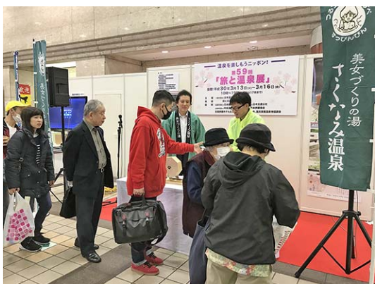
宮城県・作並温泉の観光PR (200名)