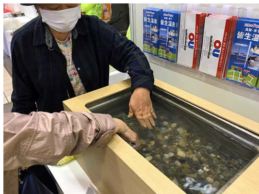
温泉の体感コーナー