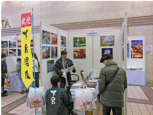
岐阜県・下呂温泉の観光PR