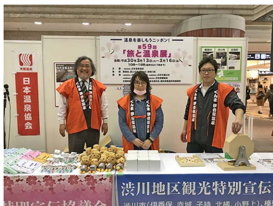
群馬県・渋川伊香保温泉PR、抽選会 (200名)