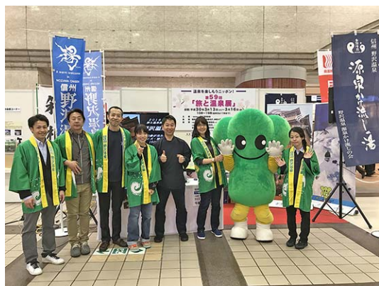
長野県・野沢温泉観光PR、クイズ大会 (280名)