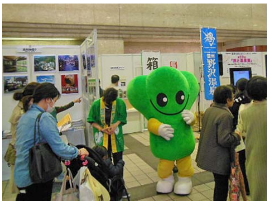
野沢温泉キャラクター「ナスキーちゃん」が大人気